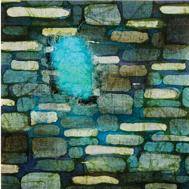
GAISMA CIETOKŠŅA MŪRĪ I / LIGHT IN THE FORTRESS WALL I vaska batika / wax batik 20 x 20 x 2