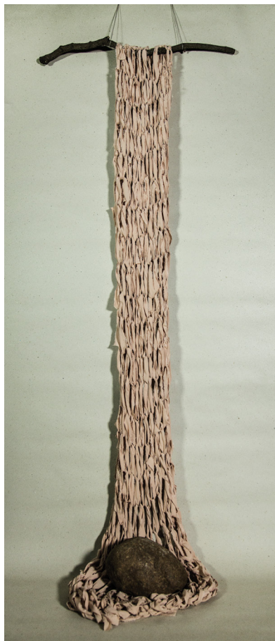
CIETOKŠŅA ATKLĀJUMI / FORTRESS FINDINGS roku adījums / hand knitting 64 x 200