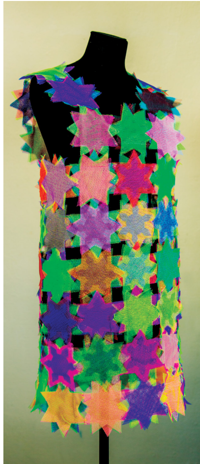
IDEĀLAIS CIETOKSNIS (SWEET 60-TIES) THE PERFECT FORTRESS (SWEET 60-TIES) tills, aplikācija / tulle, applique work 95 X 50