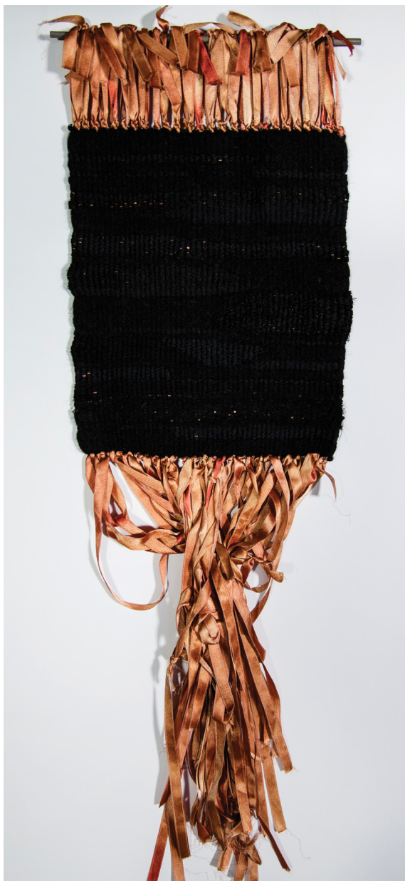
ZEMES SPĚKI / GROUND FORCE aušana, filcēšana / weaving, felting 27 x 100