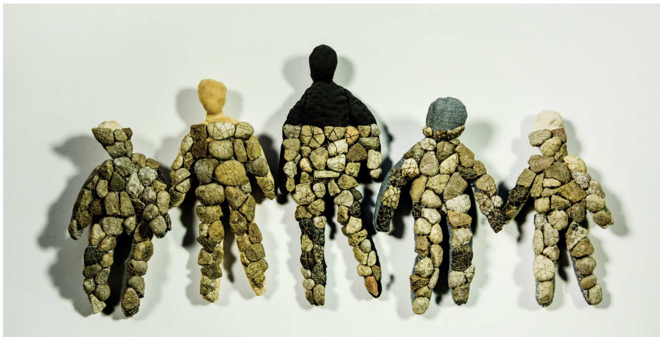
AIZSARDŽĪBA (KOMPOZĪCIJA NO 5 OBJEKTIEM) / PROTECTION (ENTITY OF 5 PIECES) audums, akmeņi, dzija, jaukta tehnika / fabric, stones, thread, mixed technique 55 x 29