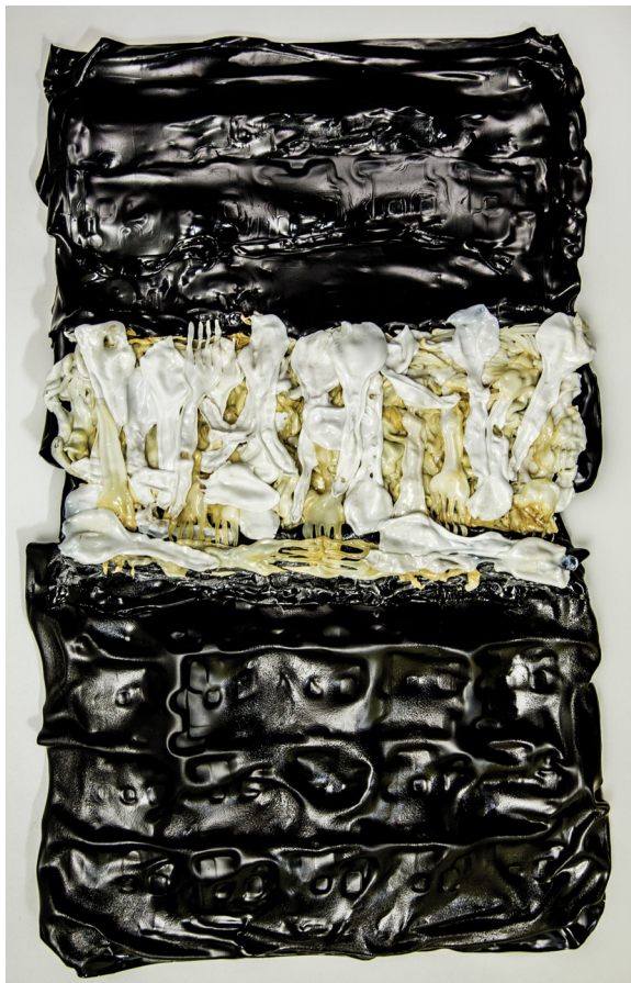
KOMPOZĪCIJA / COMPOSITION autortehnika / author's technique 63 x 38 x 3