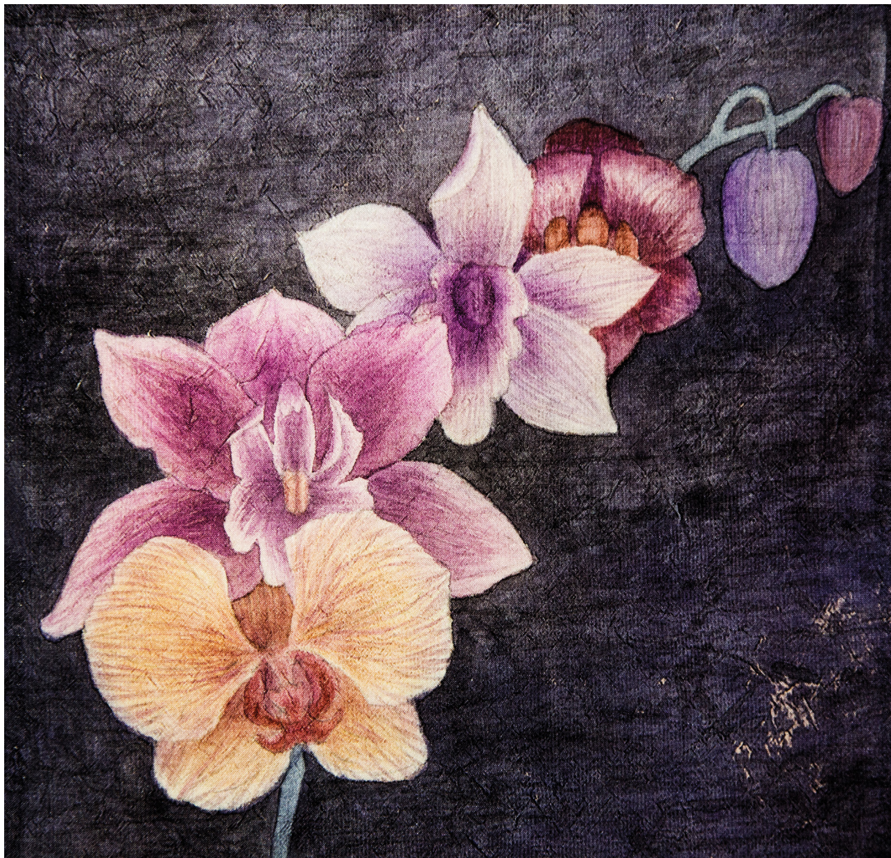
MAZMEITIŅAS UN LIELGABALS / GRANDDAUGHTERS AND A CANNON