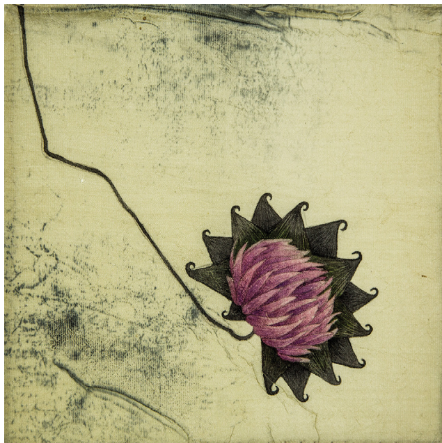
DADZIS / THISTLE gleznojums uz zīda / painting on silk 21 x 21