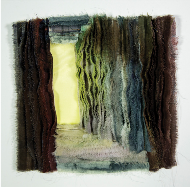
GAISMA CIETOKŠŅA MŪRĪ II / LIGHT IN THE FORTRESS WALL II vaska batika, šuvums / wax batik, stitching 20 x 20 x 2