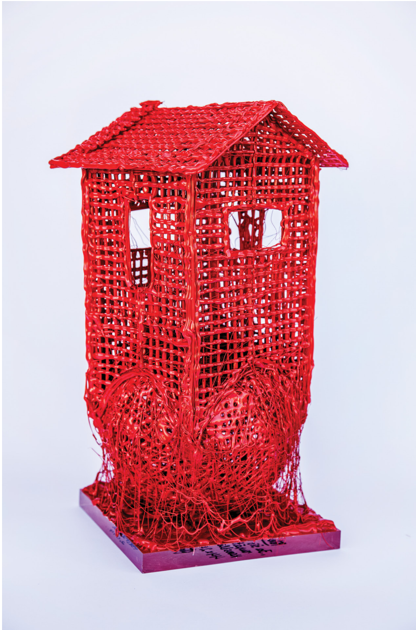
JASIENASSPĒTU RUNĀT../IF WALLS COULD SPEAK.. autortehnika/author's technique 43x23x23