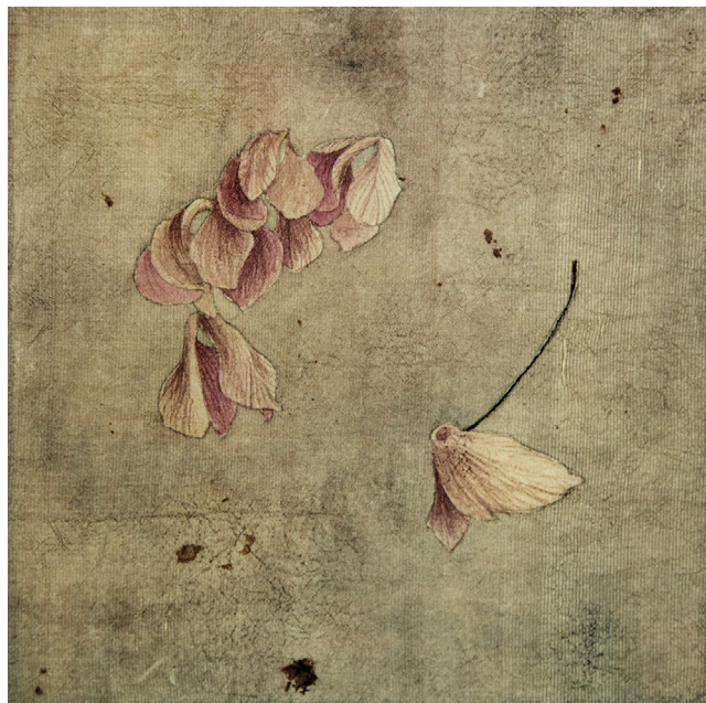
TIE, KURUS SARGĀ / THOSE, WHO ARE PROTECTED gleznojums uz zīda / painting on silk 21 x 21